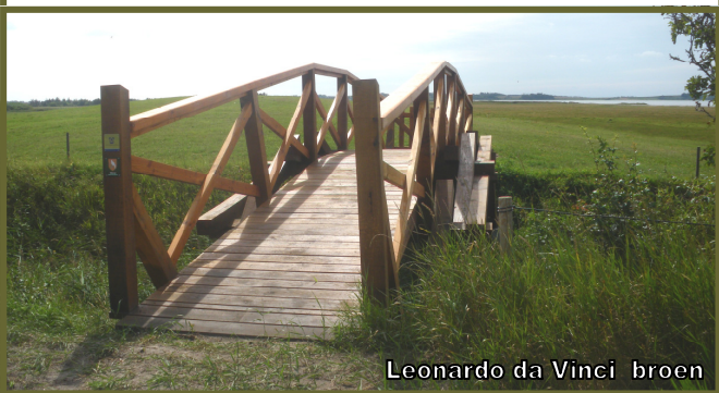
Leonardo da Vinci broen

Eksempel på én af de 7 dagsruter , en rute er ca. 20 km : MANDAG d. 20. maj. Efter gudstjeneste i Karby Kirke er der pilgrimsvandring fra Årbjerg Torn over Leonardo da Vinci broen gennem Tæbring til Dragstrup, overnatning på Drag- strup Camping.